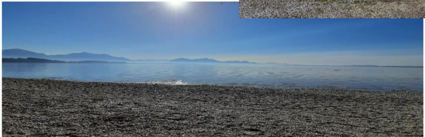
Renate & Elke on Tour